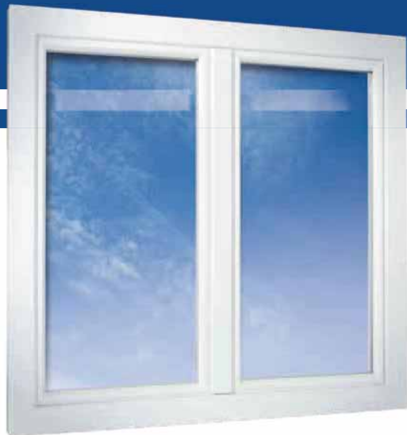
2-flügeliges Fenster in halbflächenver- setzter Variante