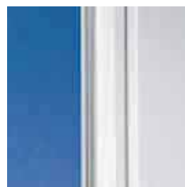
Klassisches Design mit weicher Kontur