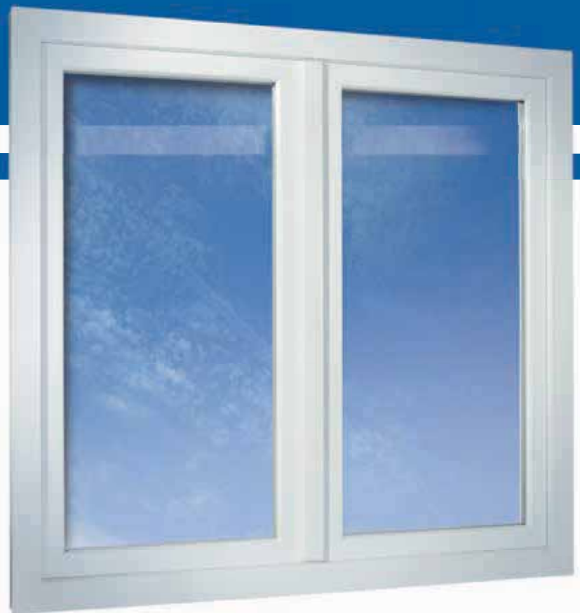
2-flügeliges Fenster in flächenversetzter Variante