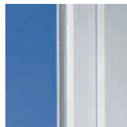
Klassisches Design mit weicher Kontur