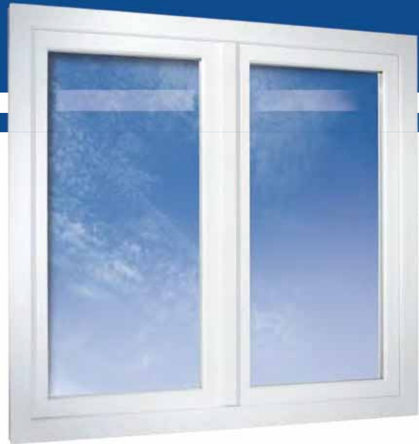
2-flügeliges Fenster flächenversetzt